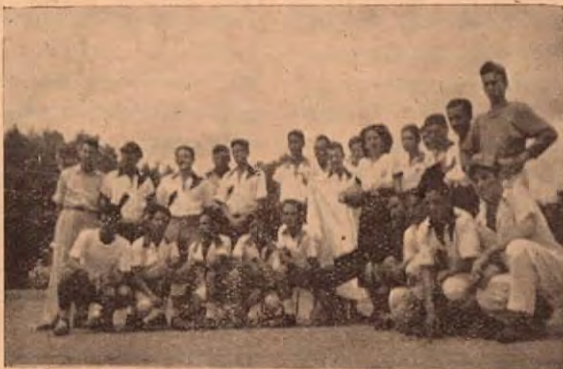
El equipo ASTURIAS de Puntarenas, se sirvió posar para nuestra Revista pocos minutos antes de comenzar su match contra el formidable cuadro AYALES de Liberia.

NOTAS: Mariposa: Taladro de aire para oradar las rocas. Burro: montón de tierra que se desprende de la parte alta del túnel.