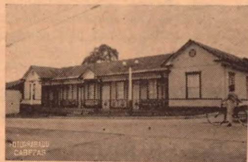
Palacio Municipal y Jefatura Política