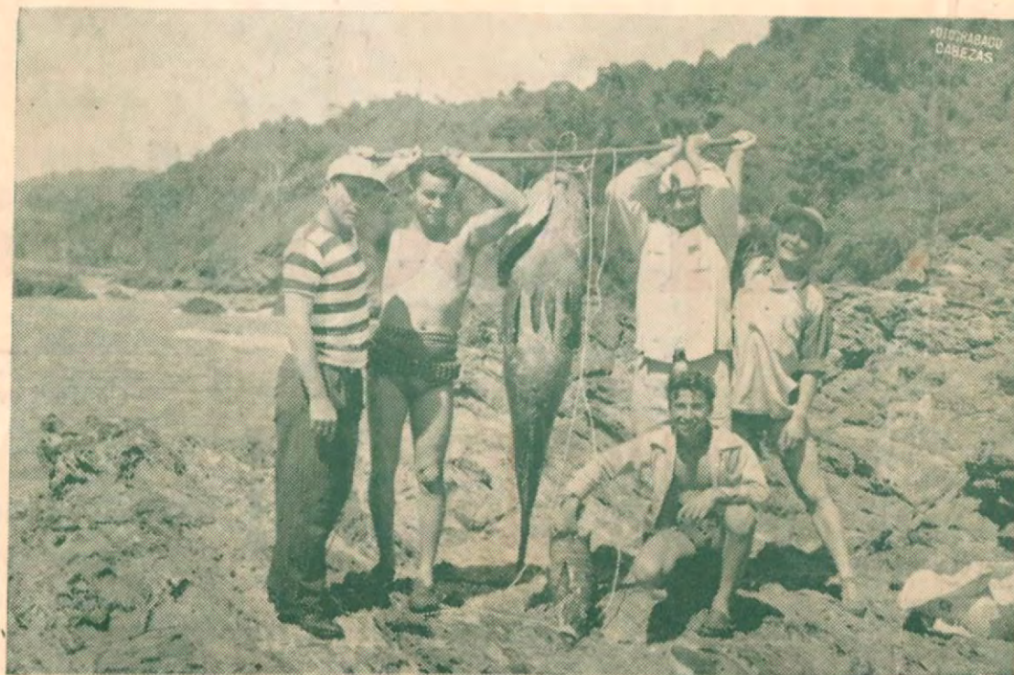
De las excursiones del Club Amateur de pesca por el Golfo de Nicoya en la escarpada costa de Los Loros